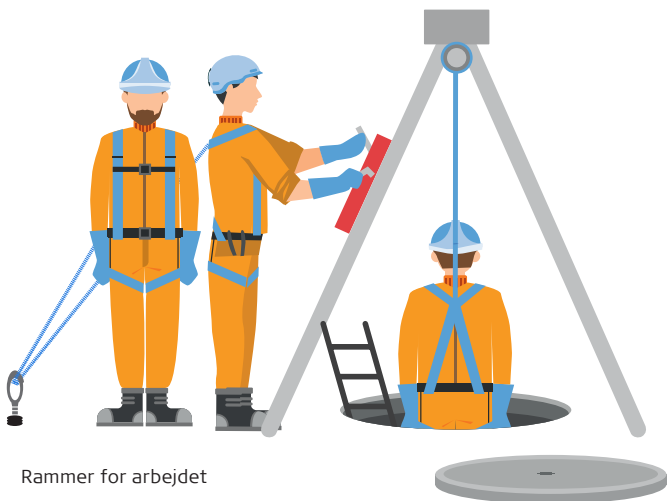
Rammer for arbejdet